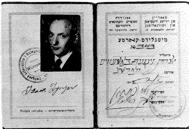
תעודת חבר של אגודת הסופרים היהודיים — הכתובת: טלומצקה 13

אדם במשקפיים עם מסגרת זהב, בעל קרחת שנצצה כמו ראי, הניף את