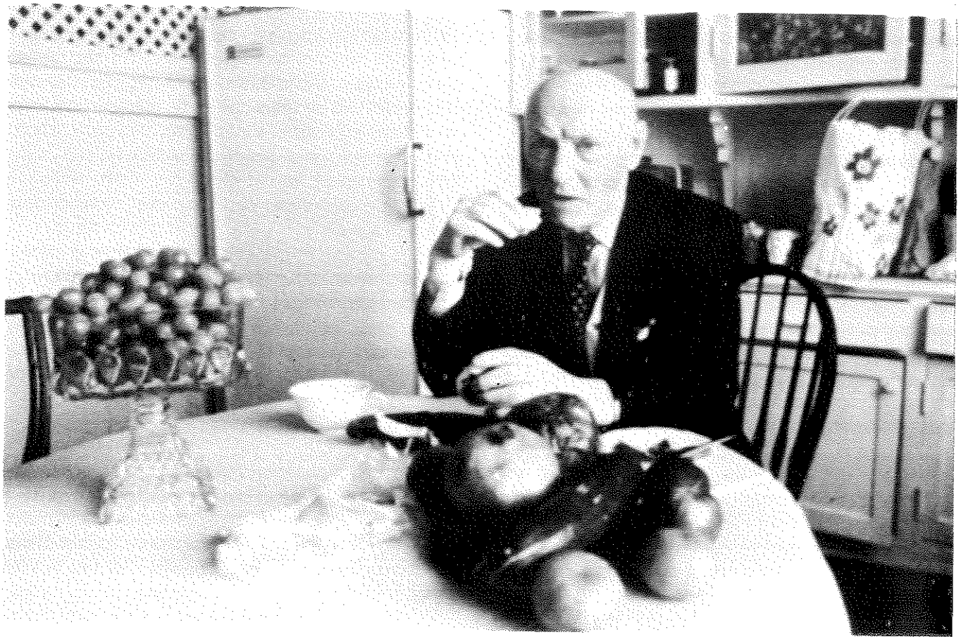
בשביסיונגר בדירתו בניו יורק

בסינגוגות הגרמניות ממלמלים בגרמנית. אך האמת היא שהריבוננו של עולם הוא גוי, לא יהודי. אני רואה אותו כמהנדס, פיסיקאי, כימאי, אסטרונום. המלאכים שלו כולם פרופסורים. ההשגחה העליונה בנויה כולה על סטטיסטיקה. אין זה מן הנמנע שהוא גרמני, או אולי אפילו אמריקני. מין אדיסון שמימי. אולי הוא אפילו אנטישמי.