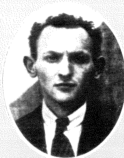
בשביס־זינגר הצעיר בווארשה