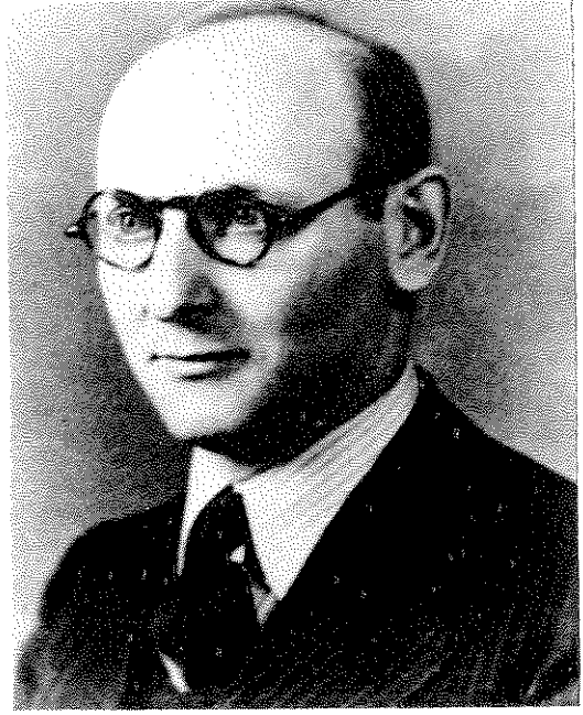
בשביטיונגר כאיש צעיר

כל כפר נידח. צריך היה לדעת כיצד לאסוף אותם. חיפשתי את האמצעים, את השיטות לכך וערכתי לי תוכניות — בלתי־ישומות, פנטסיות, בלתי־בוגרות ויחד עם זה עתיקות כמו רצון היצירה האנושי. הייתי חייב להשיג פת לחם, מיטה ללינת לילה, סבלנות, וכמו כן — דיו ונייר. כל היתר לא היה חשוב.