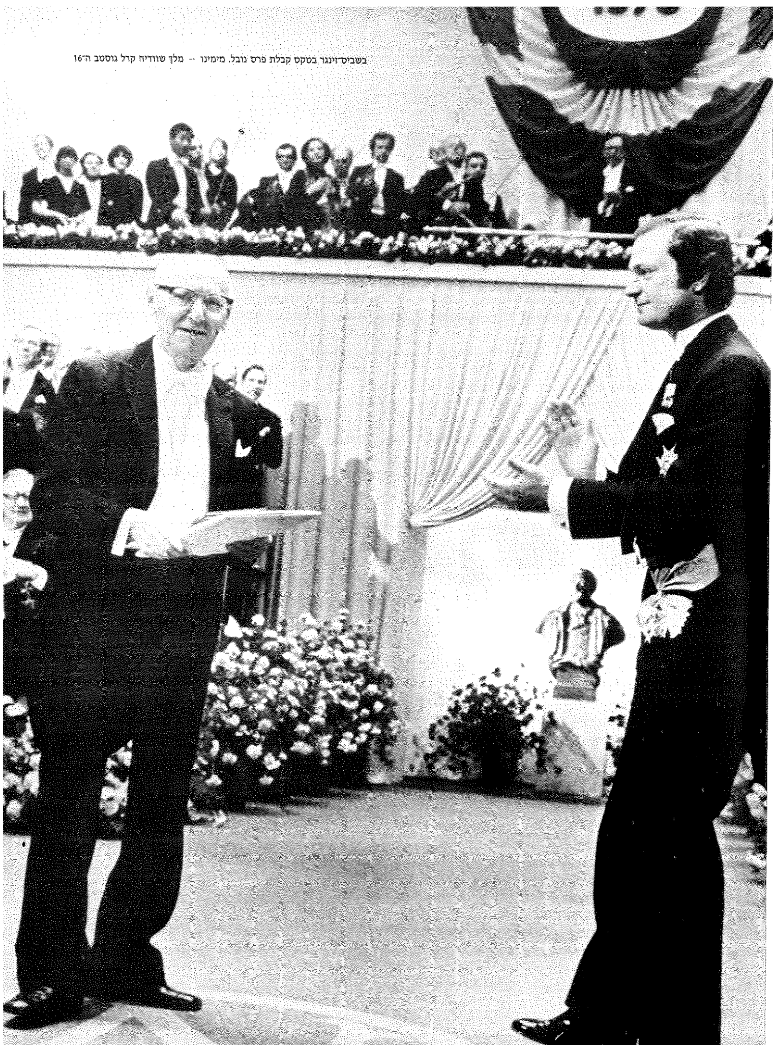
בשביס־זינגר בטקס קבלת פרס נובל. מימינו - מלך שוודיה קרל גוסטב ה־16